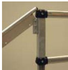
Vaiheet 5 ja 7