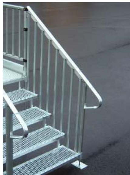
Kaidemalli 4 (pystyrimat) ja päätykaaret