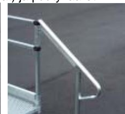
Kaide, jossa päätykaari (lisävaruste)