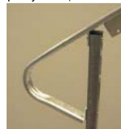
Vaihe 7 (sis. päätykaaren)