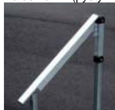
Kaide ilman päätykaarta