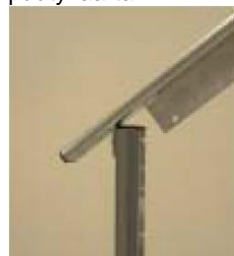
Vaihe 7 (ilman päätykaarta)