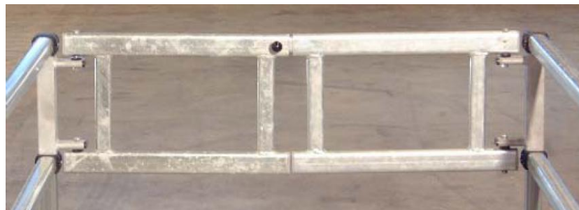
Saranahelat kiinnitetään tason kaidetolpissa olevien liitoshylsyjen väliin.