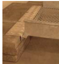
Vaihe 2 B, vaihtoehto 1