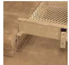
Vaihe 2 B, vaihtoehto 2